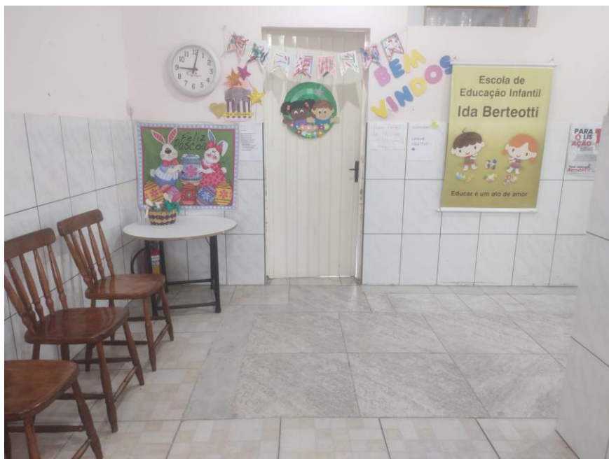
Figura 3: Hall da EMEI Ida Berteotti