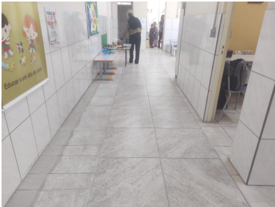
Figura 2: Refeitório da EMEI Ida Berteotti